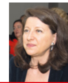
Agnès Buzyn, ministre des Solidarités et de la Santé

« Grâce à la Fédération Française de Cardiologie, l'activité physique et sportive n'est plus seulement considérée sous l'angle du loisir ou de la compétition, mais bien comme l'un des éléments de la restauration d'un « capital santé » pour tous les Français. Les Parcours du Cœur relient les notions de sport, d'inclusion, de santé, de bien-être et de prévention. Je tiens à vous remercier pour vos actions dans les établissements scolaires, là même où les enfants de tous milieux se retrouvent. Parmi les jeunes Français de 6 à 17 ans, seul 1 sur 4 atteint les recommandations de l'Organisation Mondiale de la Santé en matière d'activité physique. Celle-ci devient un enjeu plus que jamais décisif dans nos sociétés. Les Parcours du Cœur y contribuent. »