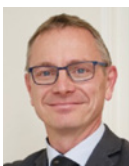
Jean-Marc Huart, directeur général de l'enseignement scolaire, ministère de l'Éducation Nationale

« De la maternelle au lycée, le parcours éducatif de santé suit les élèves, dans tous les établissements, à tous les niveaux scolaires. Il regroupe plusieurs dispositifs : l'éducation à la santé, à travers des activités pédagogiques conformes aux programmes scolaires ; la prévention des conduites à risques ; la protection de la santé des élèves, pour favoriser santé et bien-être. Les Parcours du Cœur sont une des actions auxquelles les élèves peuvent participer dans le cadre du parcours éducatif de santé, en lien avec les équipes éducatives des établissements d'enseignement. »